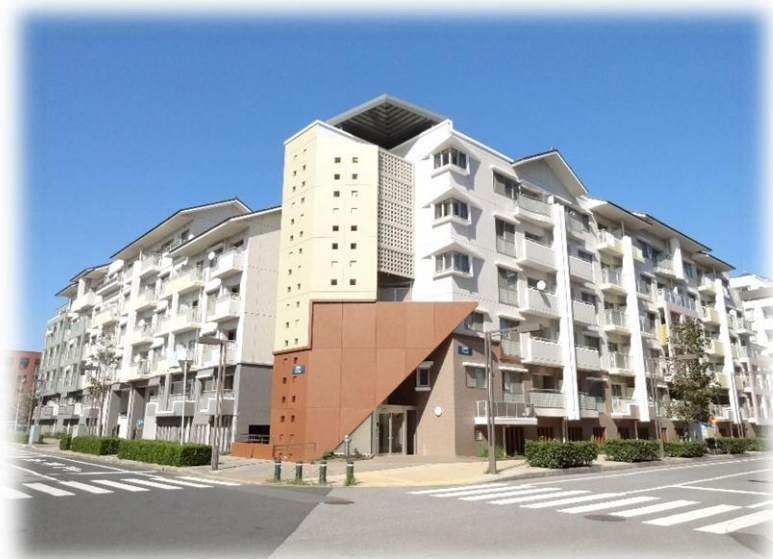
幕張ベイタウン内パティオス(賃貸住宅)