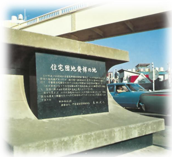
全国初の住宅団地記念碑（京成八千代台駅前）