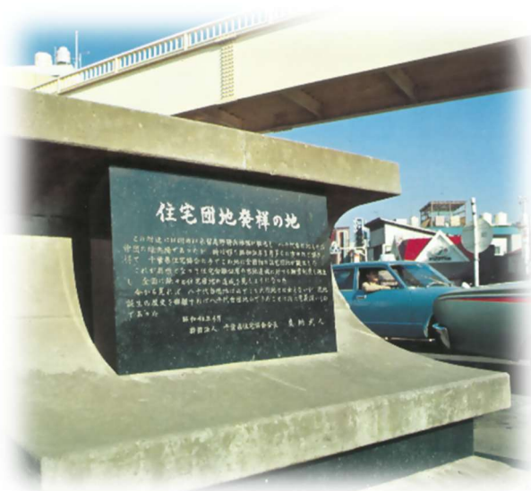
全国初の住宅団地記念碑（京成八千代台駅前）