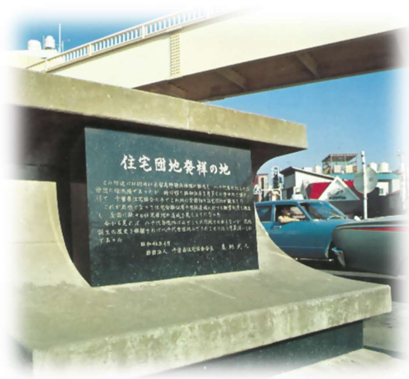
全国初の住宅団地記念碑（京成八千代台駅前）

創立70周年を迎え、今後も引き続き、千葉県の住宅政策の実施機関としての役割を担ってまいります。